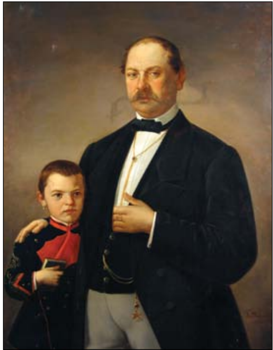
Gheorghe Tattarescu Dublu portret Nr. cat. 58