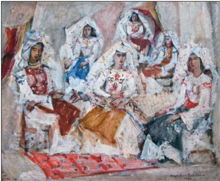
Magdalena Rădulescu Nuntă tătarească Nr. cat. 45