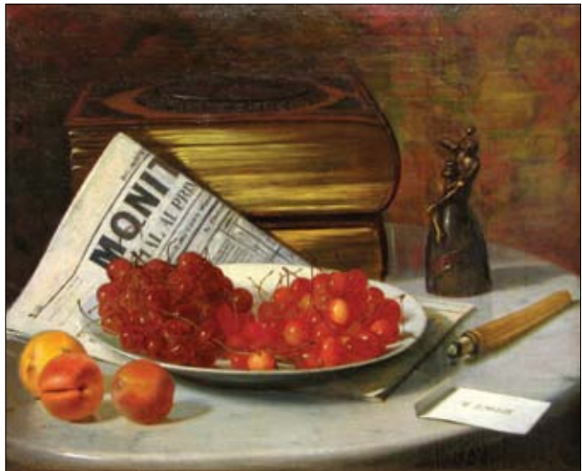
Theodor Aman Natură statică cu cireșe Nr. cat. 3