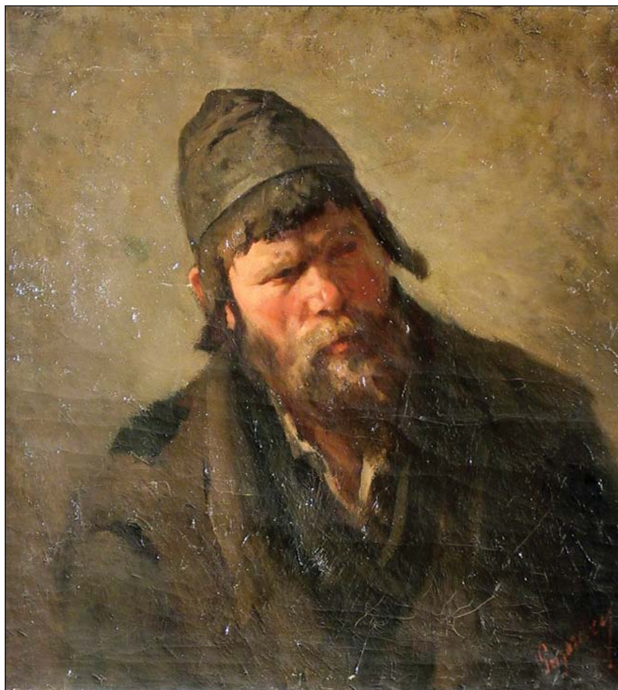
Nicolae Grigorescu Evreu din Galiția Nr. cat. 14