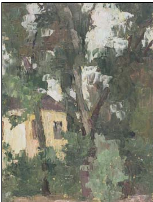
Ștefan Luchian Peisaj Nr. cat. 21