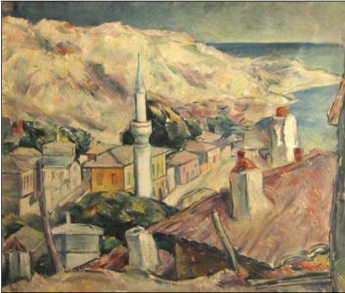
Ion Theodorescu-Sion Balciu Nr. cat. 48