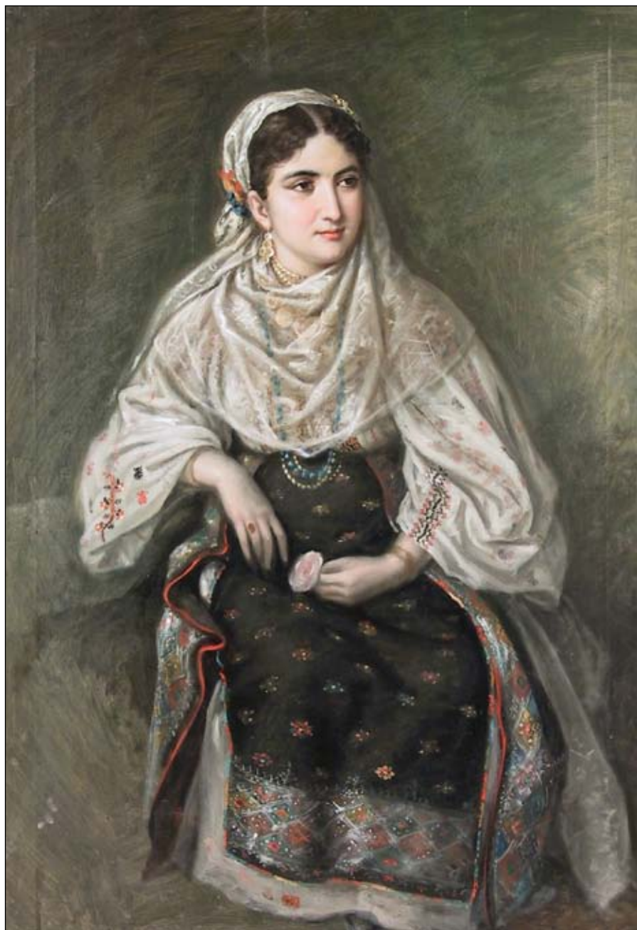
Mișu Popp Portret de femeie din Câmpulung Nr. cat. 39