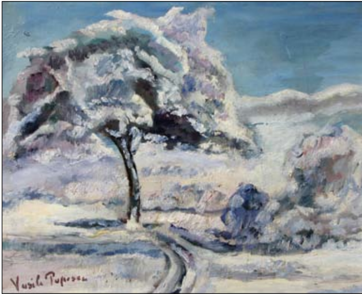
Vasile Popescu Peisaj de iarnă Nr. cat. 35