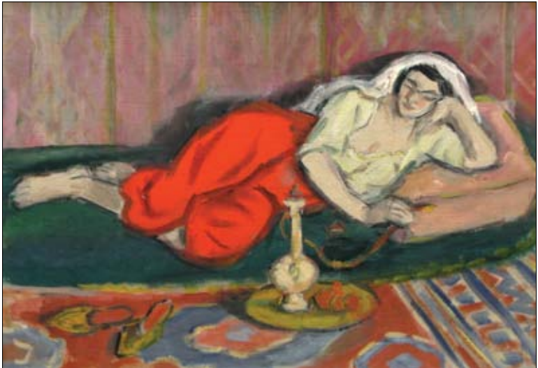
Theodor Pallady Odaliscă Nr. cat. 26