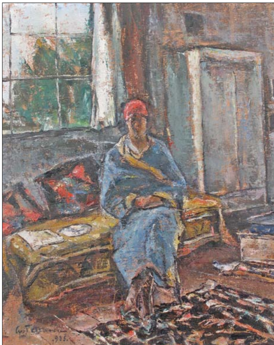
Gheorghe Petrașcu Interior cu femeie Nr. cat. 28