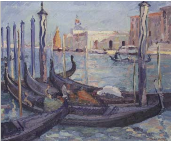
Nicolae Dărăscu Marină - Veneția Nr. cat. 8