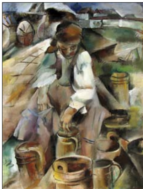
Elena Popea Țărană cu cofe Nr. cat. 31