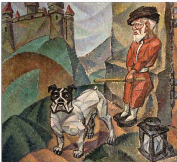
Corneliu Mihăilescu Paznicii castelului Nr. cat. 24